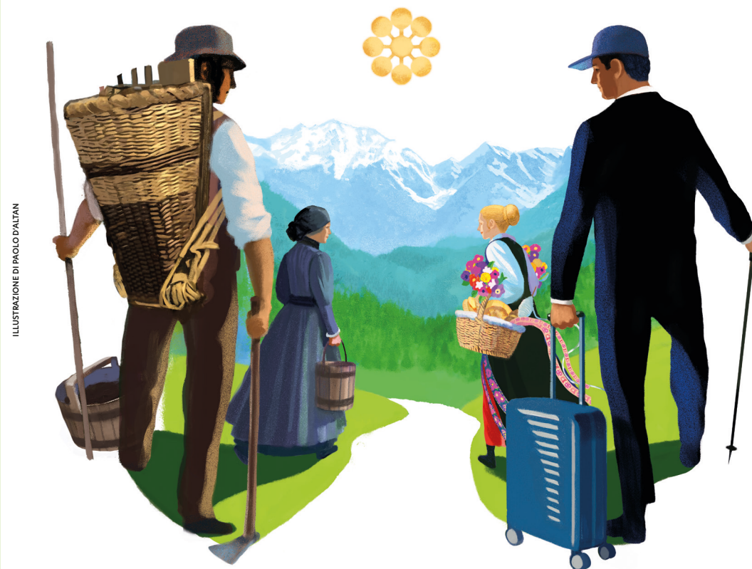
ILLUSTRAZIONE DI PAOLO DALTAN